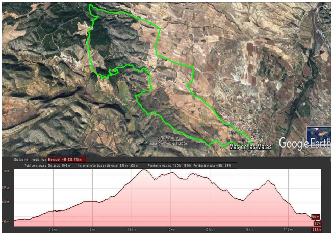
Ruta larga: 19,5 Km / 4 avituallamientos.

Comenzaremos las marchas en la Plaza del Ayuntamiento, subiendo por la calle de la Fuente de la Tejería, llegando a la Fuente de Los Pinos (km, 1), la primera que encontraremos en nuestra ruta, y donde esta situado el primer avituallamiento. Continuando por el camino de Seno, nos desviaremos por el primer camino que encontramos a nuestra derecha en dirección a Los Llanos. Pasaremos por detrás de la empresa de desguaces, y nada más rebasar el edificio, nos desviaremos a la derecha, hacia el campo de aviación, y un poco más adelante, de nuevo a la derecha, por el primer camino, que nos encontramos, en dirección a Las Pedrizas. Las dos rutas, continúan hasta La Balsa del Herrero, donde tendremos el 2º avituallamiento (km 5). A partir de aquí, las dos rutas se separan, con el siguiente recorrido: