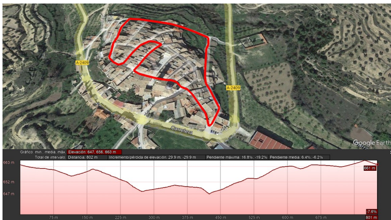
Circuito B 700 mts.