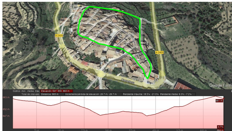
Circuito C 600 mts.